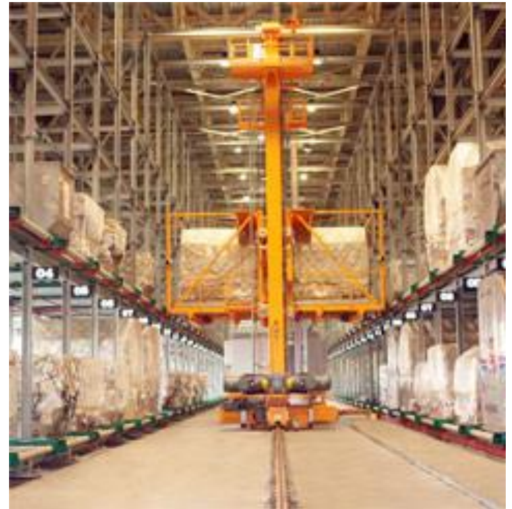
Hệ thống MHS hiện hữu

Ngày 28/09/2023 lô hàng xe nâng chuyên (ETV) của hệ thống xử lý hàng hóa hàng không (MHS) do Tập đoàn Loedige (Đức) cung cấp đã về đến Nhà ga SCSC. Đây là một trong các hạng mục đầu tư của giai đoạn 2 nâng công suất tiếp nhận, xử lý hàng hóa của nhà ga SCSC từ 200 ngàn tấn/năm lên 350 ngàn tấn/năm.