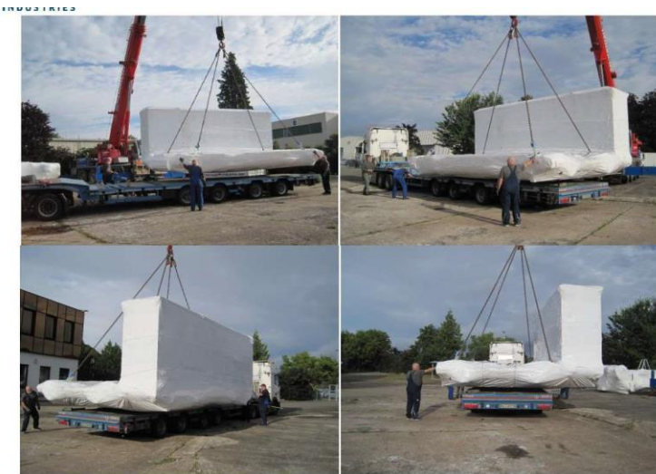
Hàng được bốc lên thiết bị vận chuyển tại nhà máy Loedige

Việc lắp đặt được thực hiện bởi các chuyên gia giàu kinh nghiệm của Loedige.