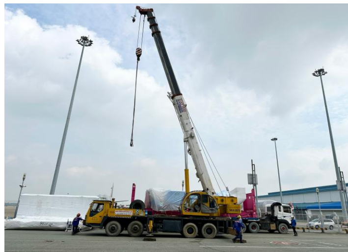
Hàng được dỡ xuống tại Nhà ga hàng hóa SCSC