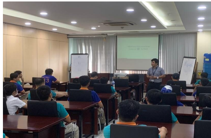
Tuyên truyền về công tác vệ sinh môi trường

Thực hiện chủ trương chung tại khu vực CHKQTTSN cùng chung tay hành động cho thế giới sạch hơn, SCSC đã tổ chức các buổi truyền thông về môi trường xanh – sạch - đẹp cho toàn thể nhân viên để nâng cao ý thức của nhân viên trong công tác bảo vệ môi trường; thực hiện vệ sinh cải thiện môi trường nơi làm việc, thu gom bao bì nhựa, nylon để tái chế.