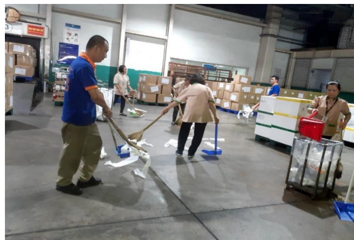
Nhân viên SCSC vệ sinh khu vực làm việc